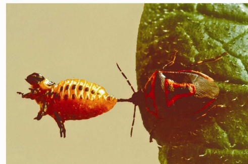
Perillus bioculatus