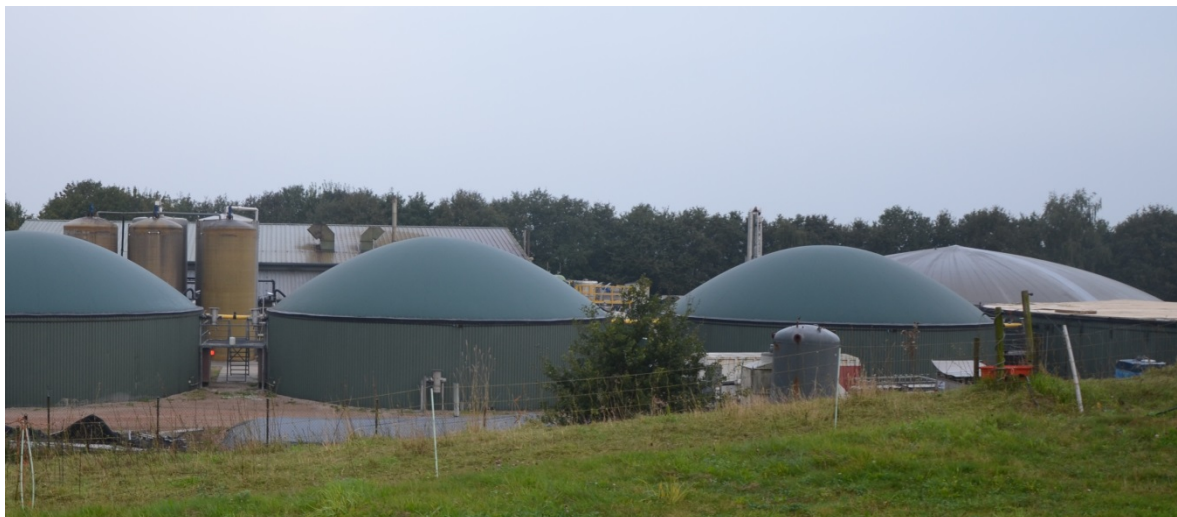
Covergisting draagt bij aan de productie van duurzame energie

Covergisting heeft echter, net als andere productiewijzen van duurzame energie, een prijs. Er is subsidie nodig, want zonder subsidie is covergisting financieel niet rendabel voor de exploitant van de vergistingsinstallatie, bij de huidige lage prijzen voor elektriciteit, warmte uit fossiele energiebronnen en groen gas. Afhankelijk van de prijs van covergistingmaterialen, die gemiddeld genomen veel meer energie leveren dan dierlijke mest, dekken de inkomsten uit de levering van biogas niet meer dan circa de helft van de exploitatiekosten. De andere helft moet uit subsidies komen. Verschillende exploitanten van vergistingsinstallaties zijn failliet gegaan doordat de inkomsten uit biogas zijn gedaald en de prijzen van covergistingmaterialen de laatste jaren hoger zijn dan aangenomen in de plannen van de covergistingsinstallatie.